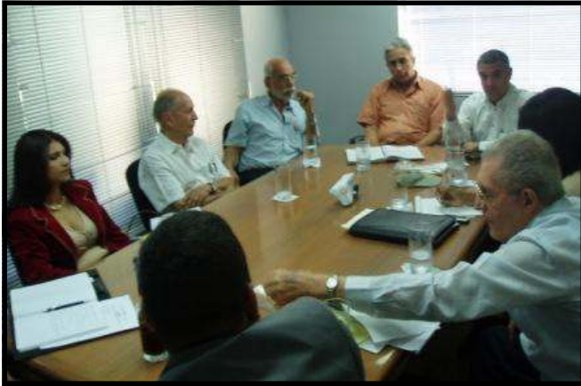
Miembros de la Fundación Pro Ciudad y profesionales independientes discuten aspectos del proyecto "Cinta Costera" en las oficinas de la Fundación.

opiniones sobre lo que se necesita para modernizar la ciudad de Panamá, especialmente el área de la Avenida Balboa.