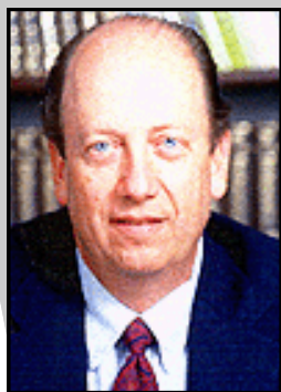
I. Roberto Eisenmann Jr., Presidente

Empresario, dirigente gremial y periodista. Fundador de más de diez corporaciones dedicadas a la banca, seguros y bienes raíces. Nieman Fellow en periodismo por la Universidad de Harvard. Ex-Director de la Sociedad Interamericana de Prensa (SIP). Miembro fundador del Fórum de Periodistas para la Libertad de Expresión e Información y del Instituto Latinoamericano de Estudios Avanzados (ILDEA). Durante 15 años fue Director y Presidente del diario La Prensa que fundó en 1980. Desde la Fundación, logró la creación de MiBanco, proyecto ciudadano de microcrédito para incluir a los excluidos.